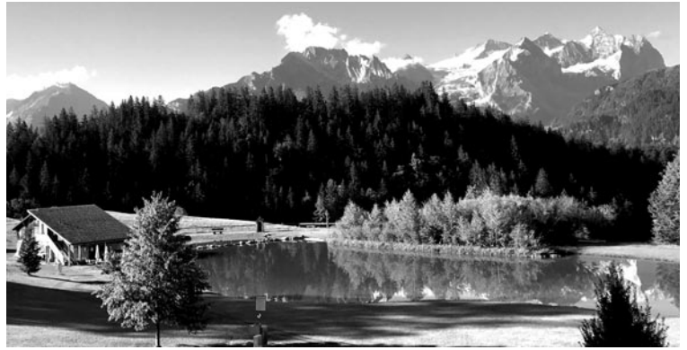
Badesees Hasliberg

Mitte April reichte die Gemeinde die Teilrevision der Ortsplanung dem Kanton zur zweiten Vorprüfung ein. Aus dem Vorprüfungsbericht, der anfangs September eingetroffen ist, geht hervor, dass mehr Anpassungen und eine Überarbeitung durch die nichtständige Kommission Ortsplanung zuhanden des Gemeinderates notwendig sind. Somit kann die Teilrevision